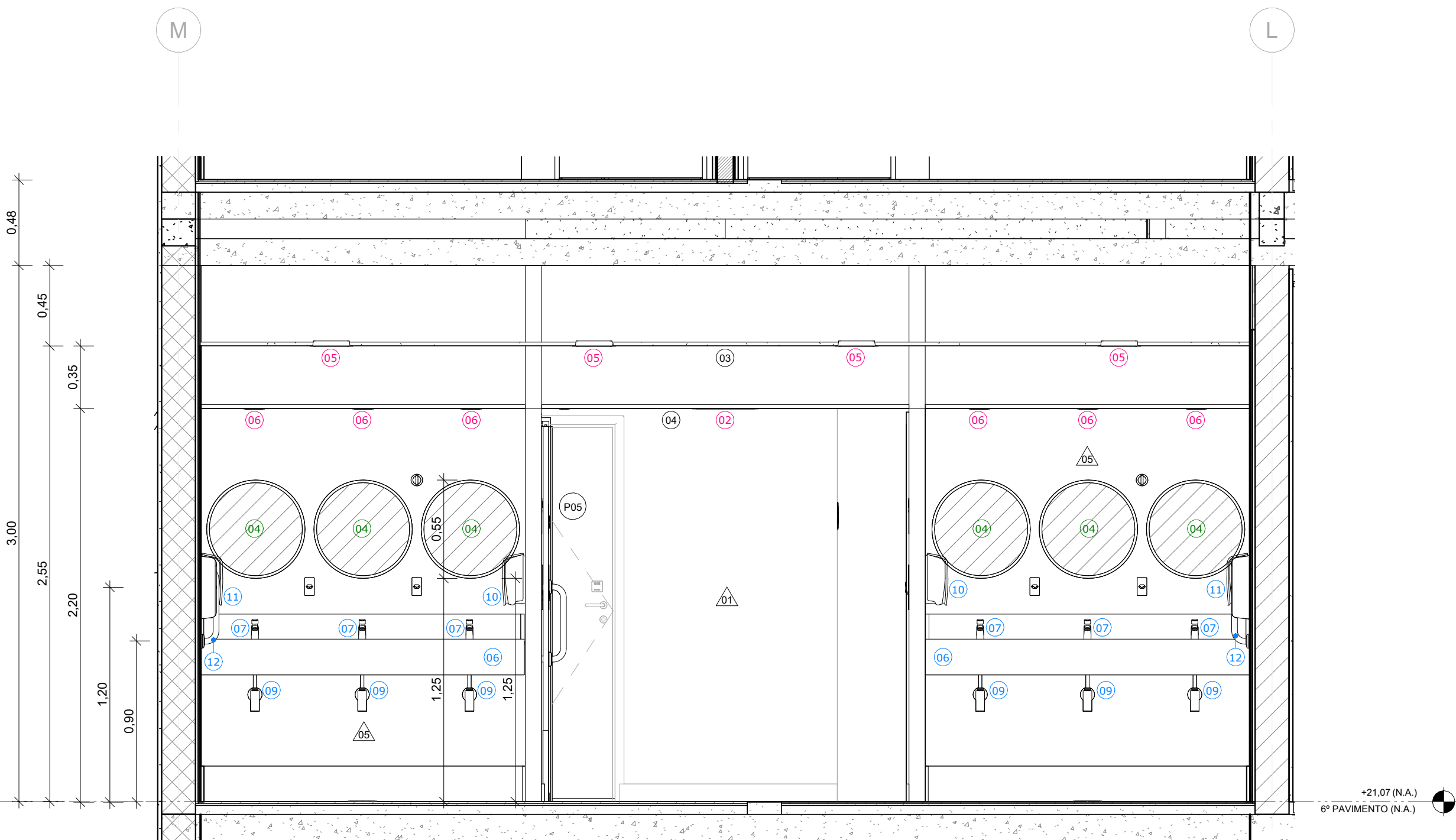
2 SANITÁRIOS ALA DIREITA - CORTE B ESCALA 1:25